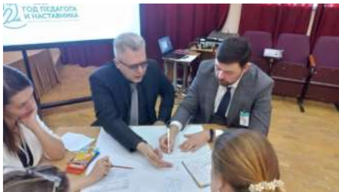
Финал конкурса «Учитель года» Район - 1 место. Город - номинация.