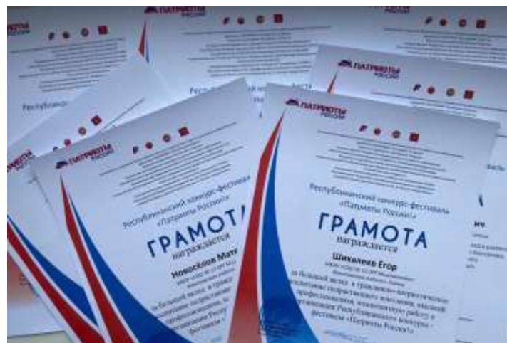
Республиканский конкурс- фестиваль «Патриоты России»