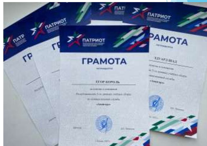
Республиканский конкурс «Авангард»