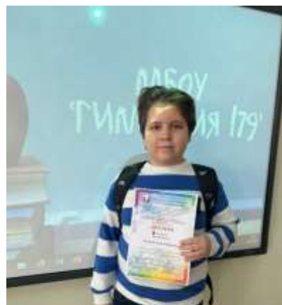
Всероссийский фестиваль творческих инициатив «Леонардо»

Республиканский конкурс «Вместе с папой»