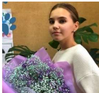
Лидер года 2023

Всероссийский математический турнир «Лига наций»